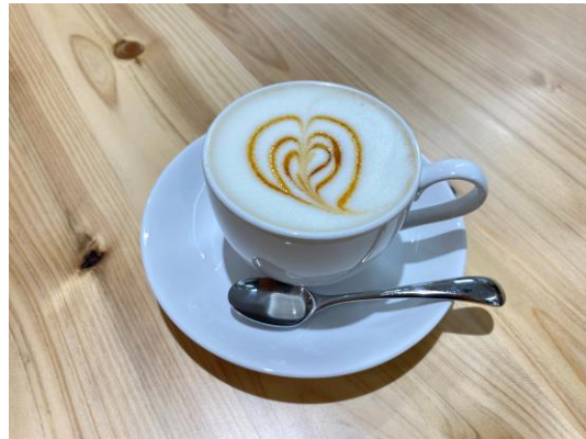
アレンジコーヒー