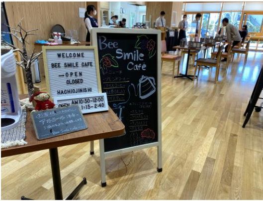
「いらっしゃいませ」