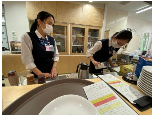
キッチンでのドリンク作り